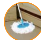
Esquinas y rincones