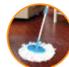
Pisos de madera