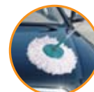
Lavado y encerado de autos

Cabeza. Única con hebras de micro fibras y gran poder limpiador que evitan los rayones y raspaduras en sus muebles y pisos.