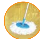
Casa y oficina